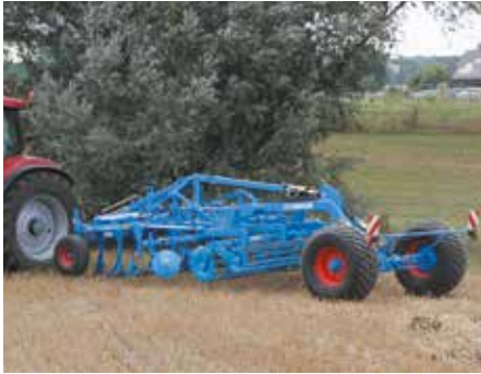
дешевле агрегат и безопаснее транспортировка

до сих пор выбор катка для навесного агрегата зависел, в частности, от подъемного усилия трактора и необходимой нагрузки на колеса на передней оси во время транспортировки. Именно поэтому нельзя было более длинные навесные агрегаты оснастить тяжелым катком для лучшего обратного уплотнения почвы. Создав новую транспортную тележку на навесных агрегатах, фирма ЛЕМКЕН решила эту проблему.